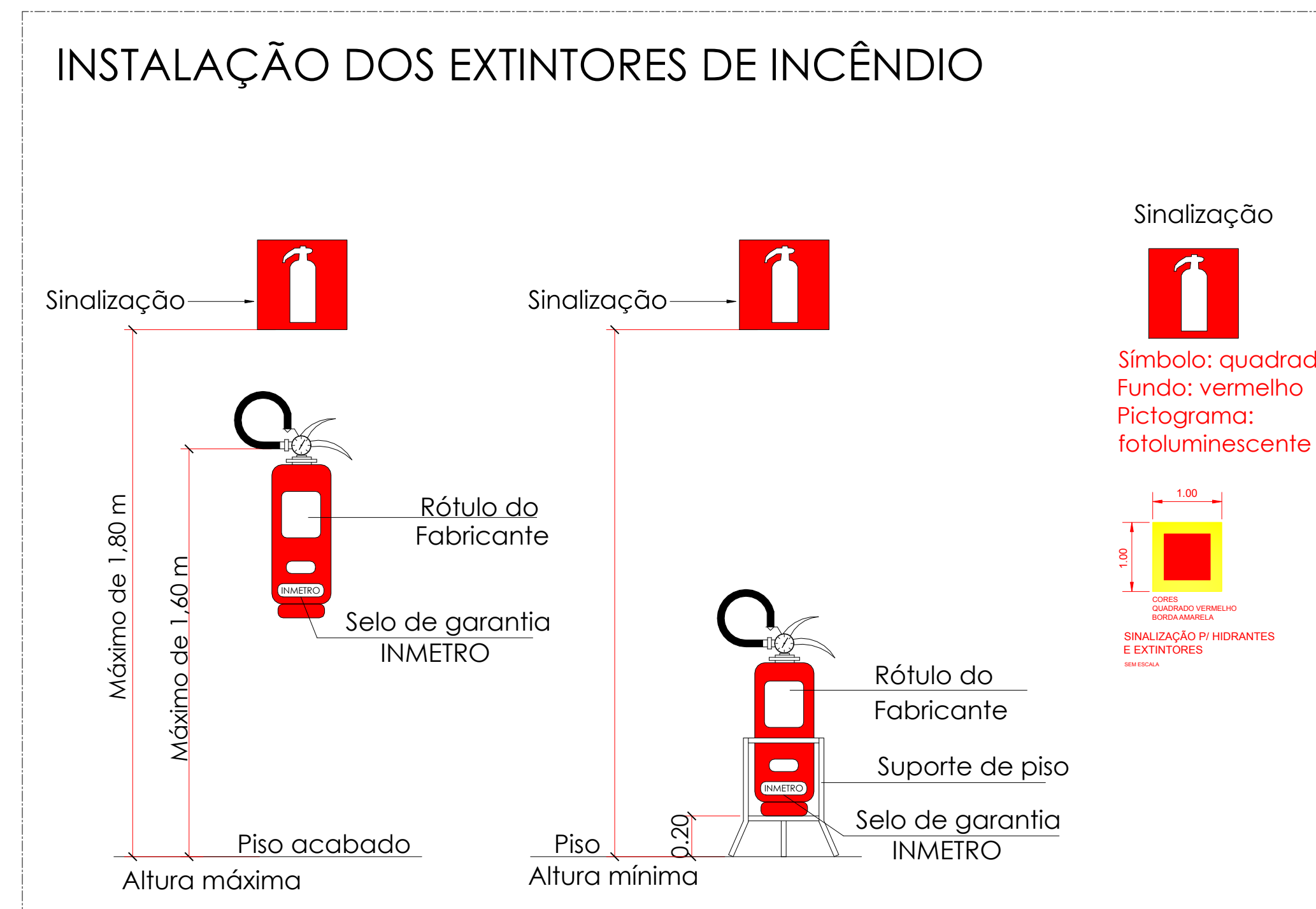
DETALHE 02 S/ESCALA

DECRETO 63.911/2018 TABELA 3 CLASSIFICAÇÃO DAS EDIFICAÇÕES E ÁREAS QUANTO À CARGA DE INCÊNDIO